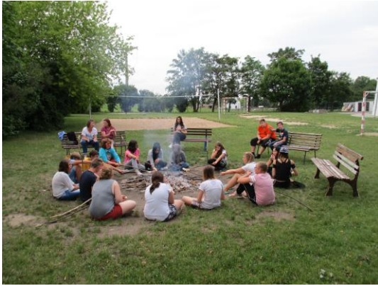
Lagerfeuer und Knüppelkuchen