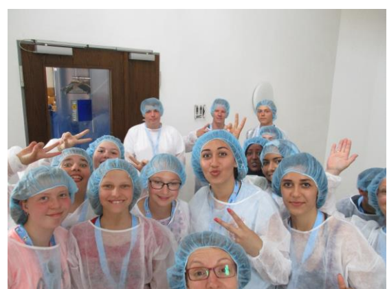
Besuch Nudelcenter Riesa GmbH