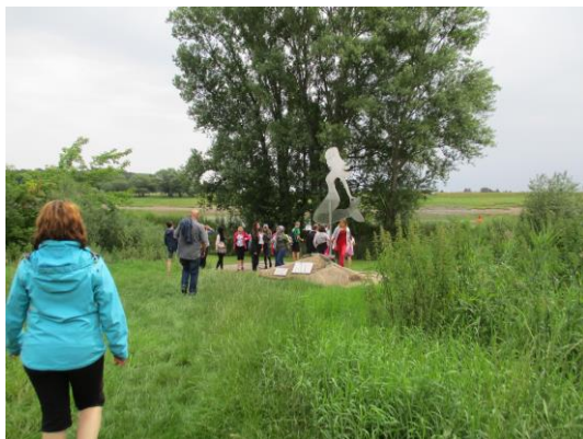
Wanderung zum Nixstein