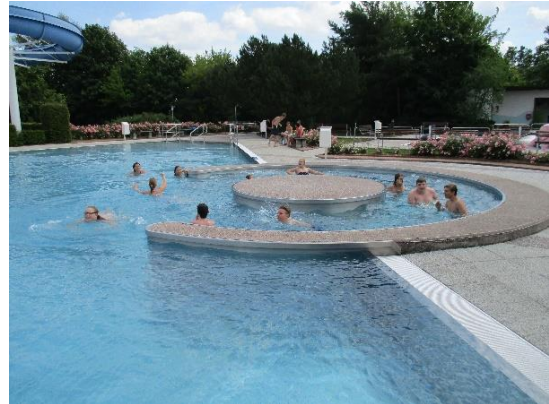
Baden im Strehlaer Freibad