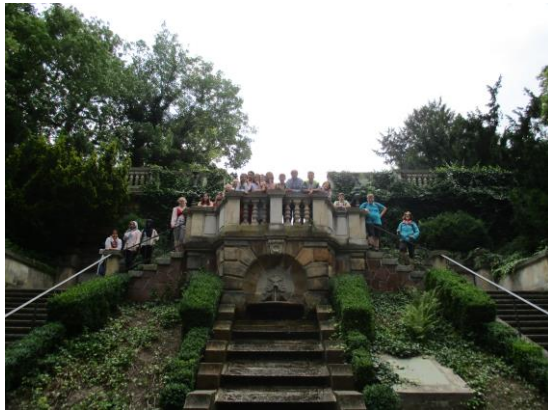
Besuch Tierpark, Elbaquarium und Kloster in Riesa