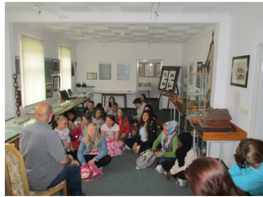
Erkundungstour durch Strehla