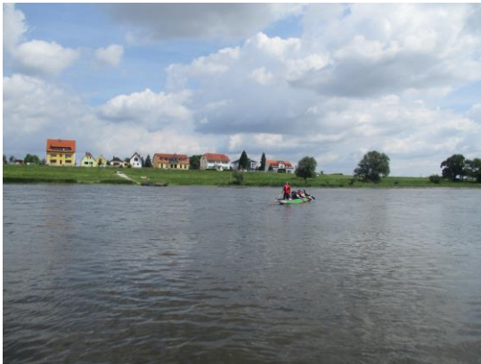
Drachenbootfahren auf der Elbe in Riesa